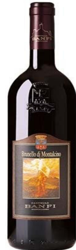
BRUNELLO DI MONTALCINO 2012 Castello Banfi

Un Rosso di Montalcino gioioso, fruttato, di bella speziatura, con note di cioccolato e tabacco. Al palato fresco, vellutato, di buona persistenza.