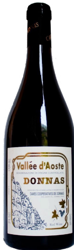
DONNAS 2014 Caves C.De Donnas

Rosso granato scarico, si apre al naso con note di ciliegia e marasca, con un finale di liquirizia e viola. Corposo e intenso, di bella persistenza aromatica e dal tannino seto.