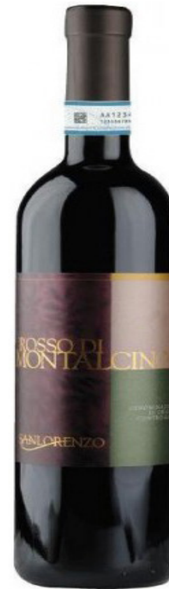
ROSSO DI MONTALCINO 2014 San Lorenzo

Vino rosso dalla buona trama aromatica, di media struttura, elegante e morbidamente tannico. Sentori di rosa e frutti di bosco accompagnati da una velata nota di caffè.