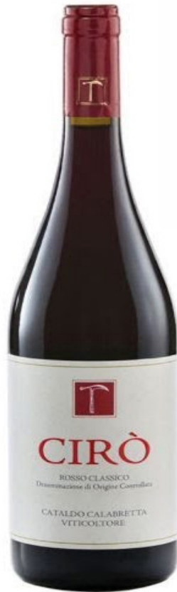
CIRÒ ROSSO CLASSICO SUPERIORE 2014 Cataldo Calabretta

Calabria, Cirò Marina Uve: Gaglioppo 14,5° - € 23